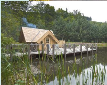
Sauna in de zwemvijver