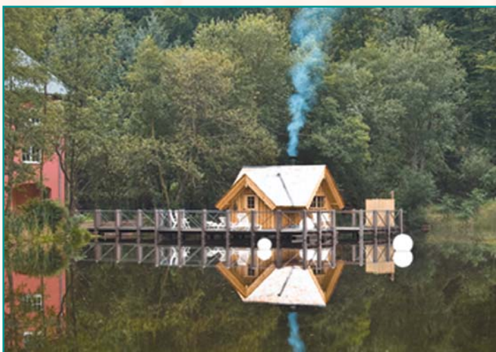
Nieuwe sauna op palen in de zwembijver