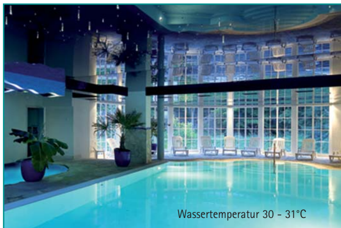
Wassertemperatuur 30 - 31°C

Kaarten voor dagtochten zijn bij de receptie verkrijgbaar.