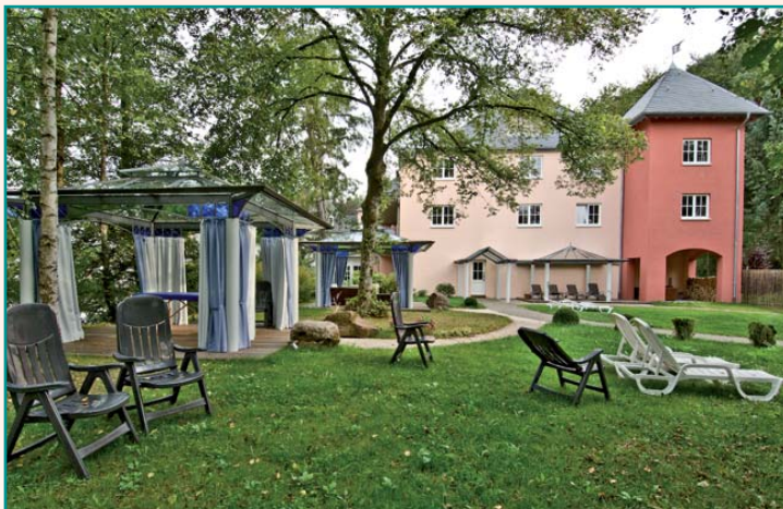
Ligweide met massage paviljoens