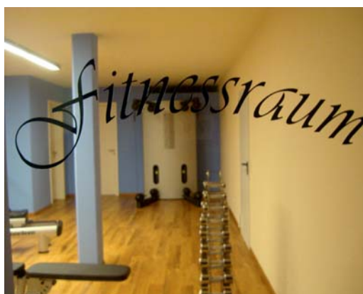
Nieuwe Fitness ruimte